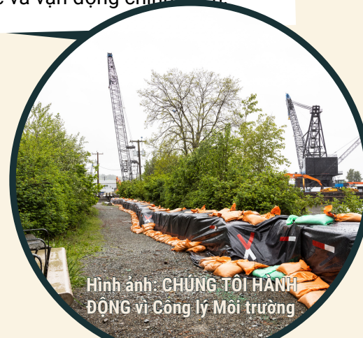
Hình ảnh: CHUNG TÔI HẠNH ĐÔNG vì Công lý Môi trường